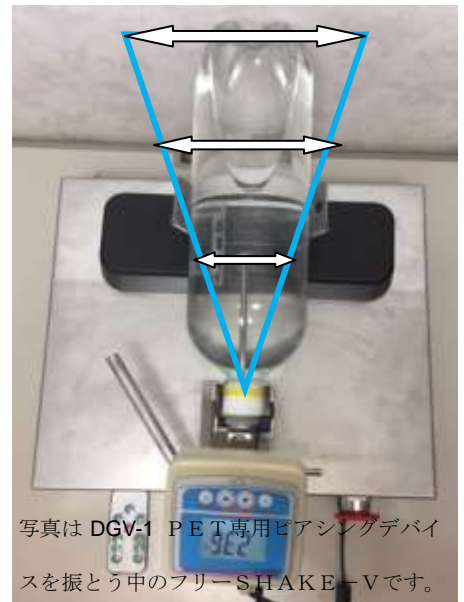
写真は DGV-1 PET 専用ピアシングデバイスを振とう中のフリーSHAKE-Vです。